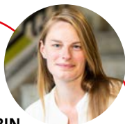
AUTORIN DR. ANN-KATHRIN BIEWENER

Das Bezirksamt muss außerdem mit Nachbarschaften ins Gespräch kommen, informieren und aufklären, wie mit Drogenabhängigkeit vor Ort umgegangen wird. Beratungsstellen wie Fixpunkt brauchen mehr Personal und Geld, damit sie mehr Menschen erreichen können. Mehr Angebote helfen, dass niemand durchs Raster fällt. Polizei, Ordnungsamt und BSR sollen an den Hotspots des illegalen Drogenhandels stärker präsent sein. Gleichzeitig müssen benutzte Spritzen und andere Hinterlassenschaften schnell aus dem öffentlichen Raum entfernt werden. Nur wenn Hilfe, Prävention und Sicherheit zusammenspielen, kann Charlottenburg-Wilmersdorf ein lebenswertes Zuhause für alle bleiben.