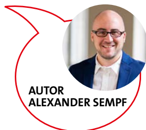
AUTOR ALEXANDER SEMPF

Dieser Haushalt hätte ein Signal für Fortschritt sein können. Wir als SPD-Fraktion wollen die Zukunft in Bildung, Kultur und sozialer Infrastruktur sichern. CDU und Grüne haben sich leider für den entgegengesetzten Weg entschieden. Unsere Aufgabe bleibt es, Charlottenburg-Wilmersdorf als einen Bezirk zu erhalten, der allen Chancen bietet, unabhängig von Geldbeutel, Alter oder Herkunft.