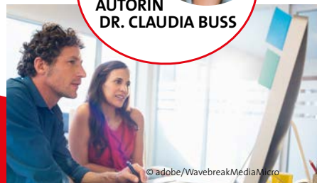
Durch Digitalisierung übermäßige Bürokratie reduzieren