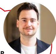
AUTOR NICO KAUFMANN

Charlottenburg-Wilmersdorf braucht zudem eine aktive Bodenpolitik, einen konsequenten Schutz vor überhöhten Mieten, eine verschärfte Mietpreisbremse, Reformen beim Mietspiegel und klare Regeln für möblierte Wohnungen. Mietwucher muss verfolgt und Eigenbedarfskündigungen dürfen nicht zur Verdrängung führen. Neuer Wohnraum muss von Anfang an mit der Umgebung gedacht werden: mit sozialer Infrastruktur wie Kitas, kurzen Wegen und einer schnellen Integration ins ÖPNV-Netz. Ein lebenswerter Bezirk entsteht dort, wo Wohnen wieder Sicherheit gibt. Die SPD steht dafür, Wohnraum zu schützen, Neubau gemeinwohlorientiert zu fördern und Menschen vor Verdrängung zu bewahren.