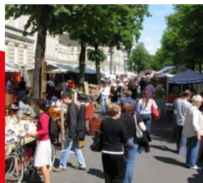
Märkte sind lebendige Treffpunkte