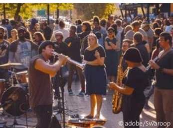
Kiefestere stärken die Gemeinschaft